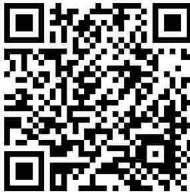
QR CODE DA CELLULARE