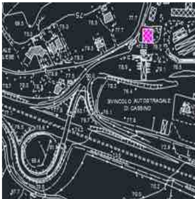
PRESIDIO 2 SEDE PROTEZIONE CIVILE GRUPPO COMUNALE CASSINO