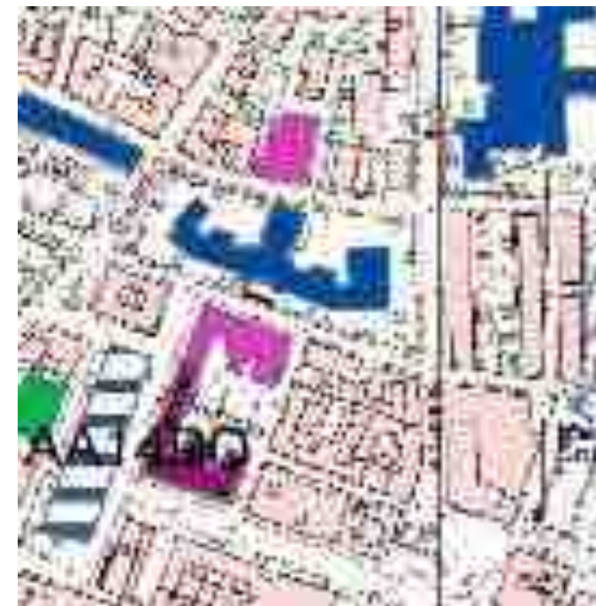
PRESIDIO 1 - COMUNE DI CASSINO