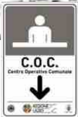
C.O.C SCUOLA MEDIA G. DI BIASIO