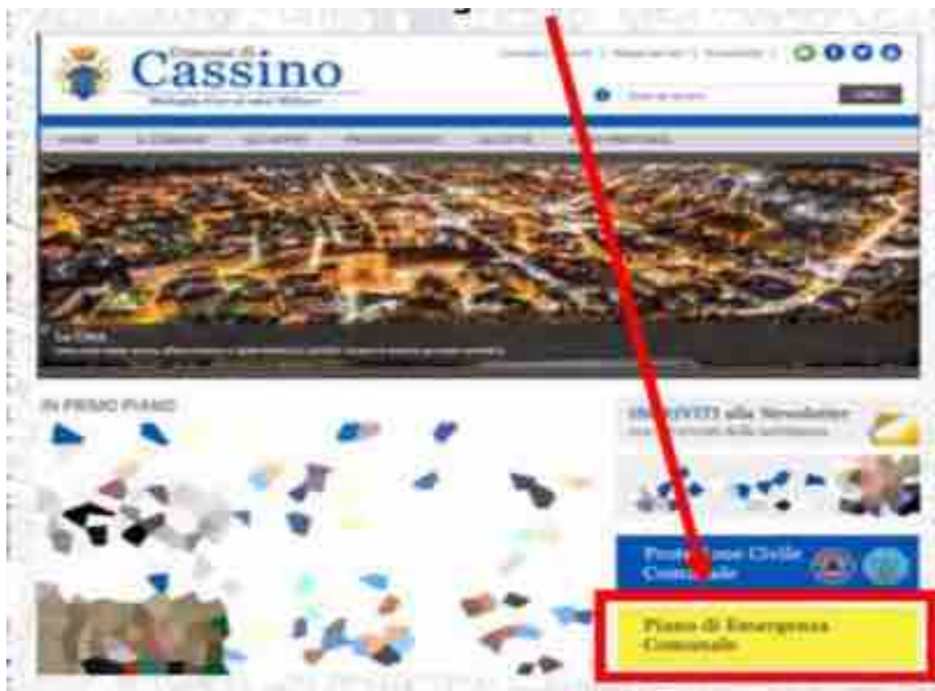
SITO ISTITUZIONALE COMUNE CASSINO